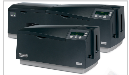
DTC550 är flexibel och kan printa kort till alla olika organisationer såsom företag, skolor, sjukhus och militär.

Är risken för förfalskning stor inom ditt företag, eller är det fysiska slitaget på stort? – då bör du överväga att beställa eller utöka din DTC550 med en lamineringsstation. Fargo's laminat ger dina kort ett högre skydd bland annat i form av hologram och microtexter. Laminatet som är upp till 1 mil (1/1000 tum) ger ett mycket bra fysiskt skydd, tex när man dagligen drar kortet i en kortläsare. Det finns även ett särskilt laminat med uttag för chippet på smart card.